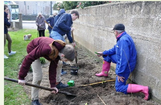
Plantation Pommes de terre Aumônerie 2022-03-05