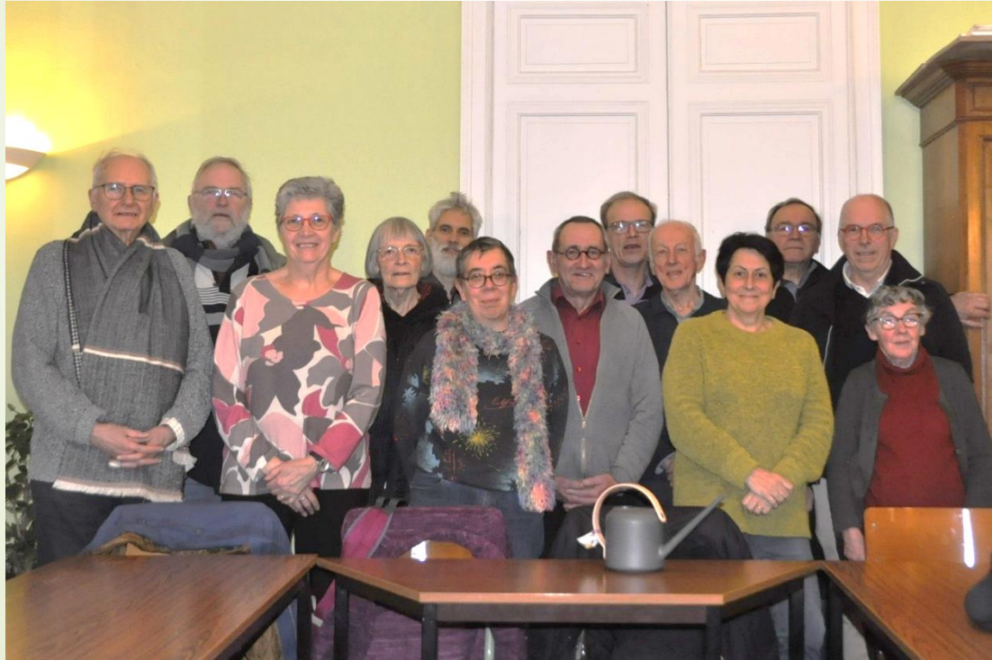
Membres de l'équipe Eglise Verte