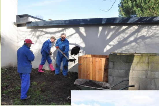
Installation du compost à St Jean Baptiste 2020-01-18