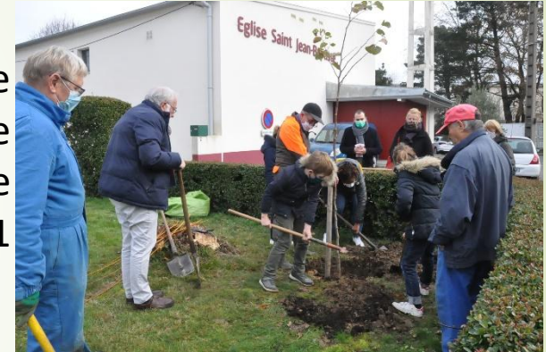
Plantation d'un arbre de Judée à St Jean Baptiste KT primaire 2021-12-11