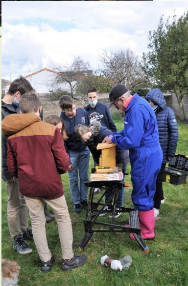
Atelier nichoir Aumônerie 2022-03-05