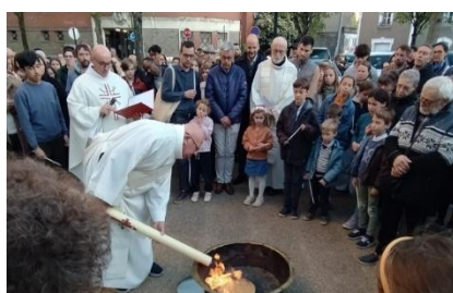
Vigile pascale et fête de la Résurrection