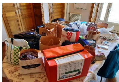
Noël dans notre paroisse